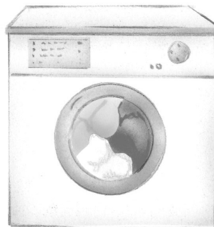
la machine à laver