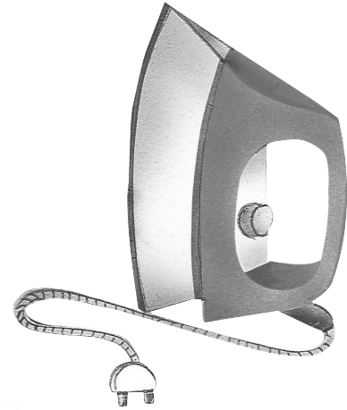
le fer à repasser