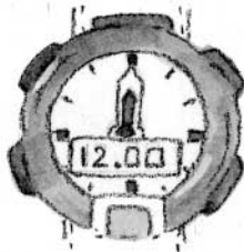
la montre de plongée